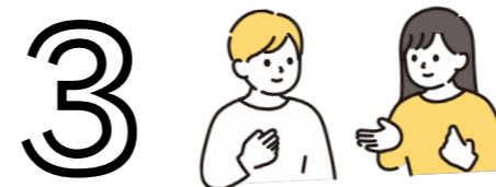
LEPは毎年大人気！興味のある方は、お早めのお申込みを！