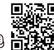
←ブログはこちらから