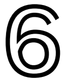
Read the blog here