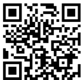
ブログはこちらから