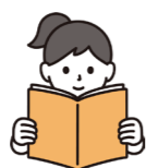
Read the blog here