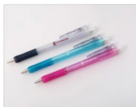
ボールペン・シャープペン 各105円（税込）