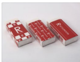
消しゴム 各200円（税込）