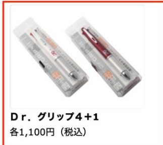
Dr. グリップ4+1 各1,100円（税込）