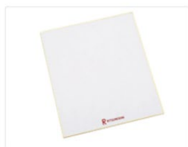
色紙 188円（税込） ※2024年8月1日～ 価格改定いたします。 改定後 209円（税込）