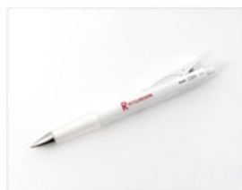
オプト シャープペンシル 220円（税込）