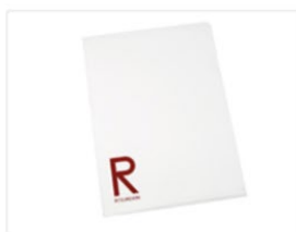
クリアファイル 80円（税込）