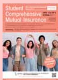
学生総合共済パンフレット