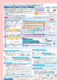
加入申込書記入例